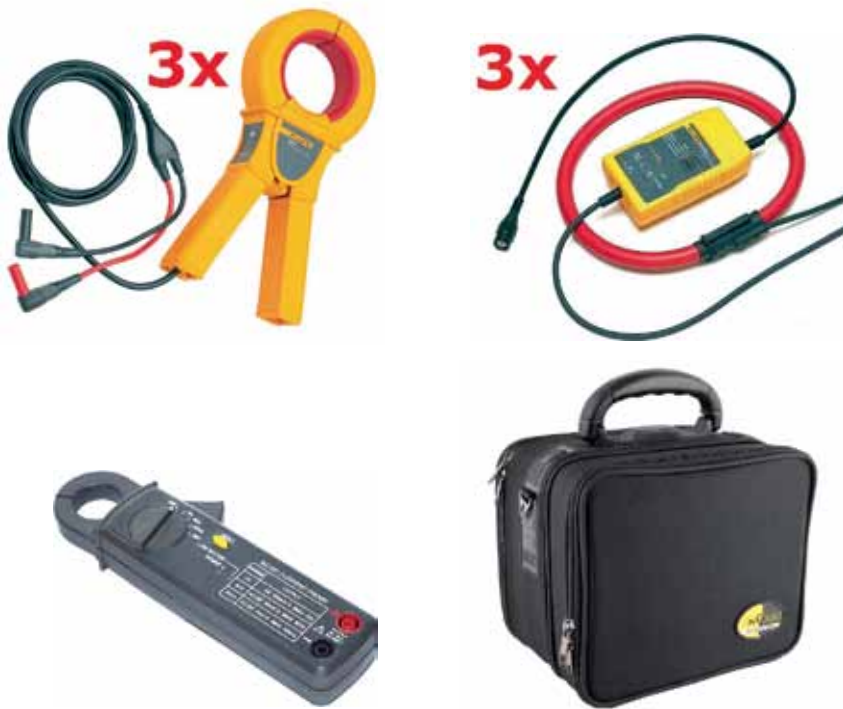
Рис. 2. Дополнительные комплекты токовых клещей на ~800 А (АС), ~2000 А (АС) и =200 А (DC)

ческую векторную диаграмму токов и напряжений, что как раз требуется при настройке, контроле и проверке схем РЗА и ПАЗ. Прибор автоматически распознает подключаемые к нему токовые клещи, которые позволяют измерять значения токов без разрыва цепи: штатные – на ~30 А (рис. 1), опциональные – на ~800 А, ~2000 А и =200 А (рис. 2).