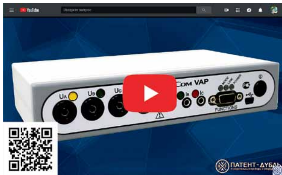
Рис. 6. Видеообзор вольтамперфазометра (ВАФ) AnCom VAP

▸ онлайн-библиотека справочной литературы и приложений для быстрых расчетов всегда под рукой;