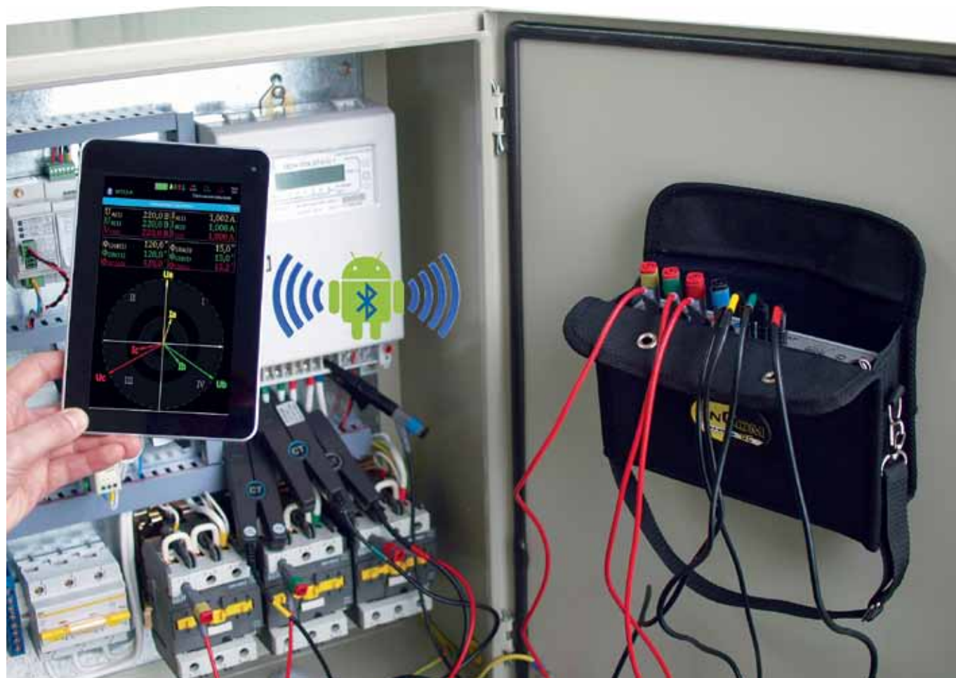
Рис. 1. Трехфазный ВАФ AnCom VAP со штатным комплектом токовых клещей на 30 А

Измерительные входы – три по току и три по напряжению – позволяют в режиме реального времени выдавать на дисплей планшета динами-