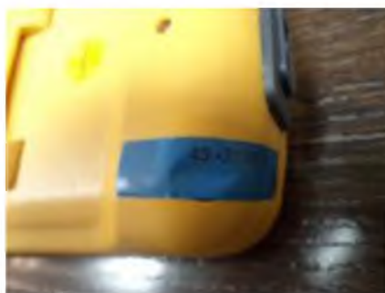
Рисунок 2. Фотография пломбирования мультиметров цифровых серии VA2