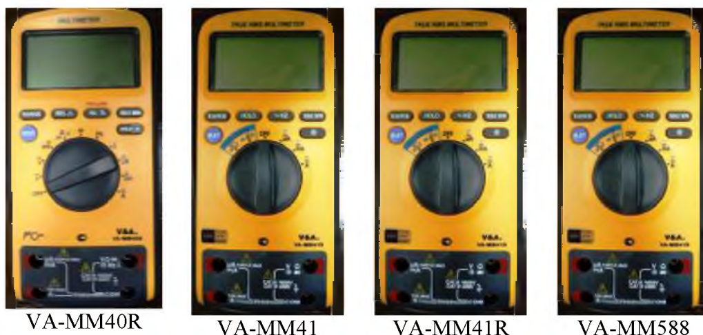
Рисунок 1. Фотографии общего вида мультиметров цифровых серии VA2