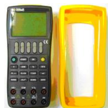
Съемный защитный чехол