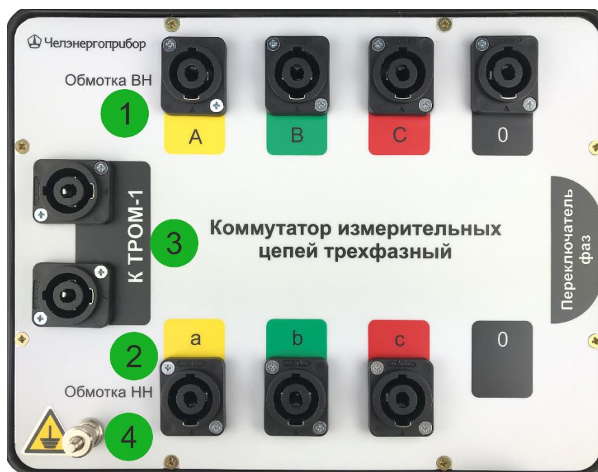
Рис. 1. Лицевая панель коммутатора

Вид лицевой панели коммутатора показан на рис. 1.