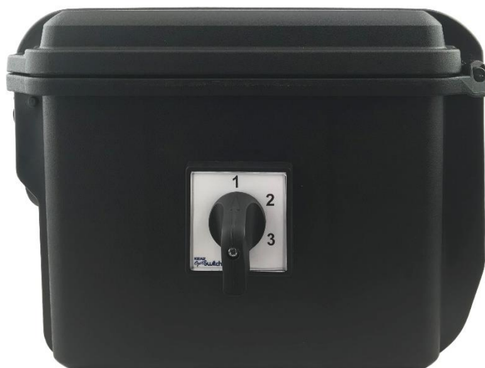
Рис. 2. Переключатель фаз

Переключатель фаз расположен на правой боковой стенке коммутатора (рис. 2) и представляет собой пакетный переключатель, который позволяет направлять измерительный ток в различные измерительные провода согласно схеме подключения.