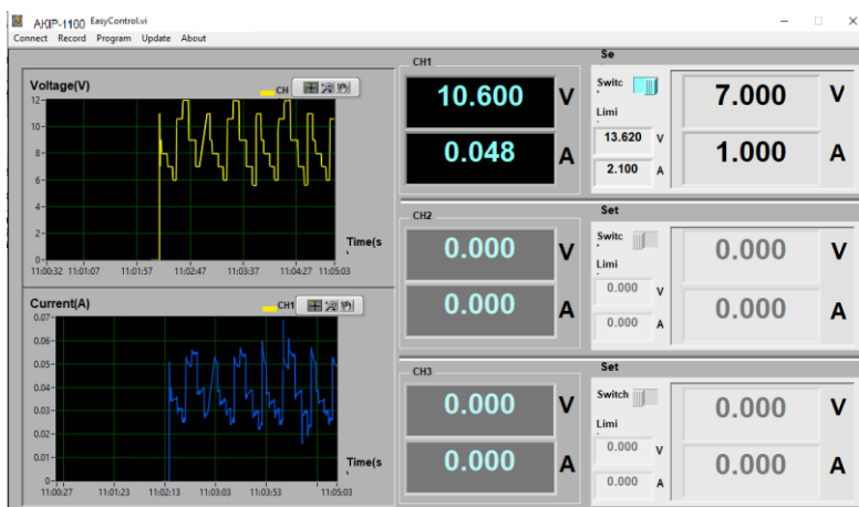
Интерфейс ПО Easy Control